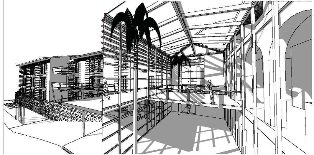
Coupe-Détail sur Forum